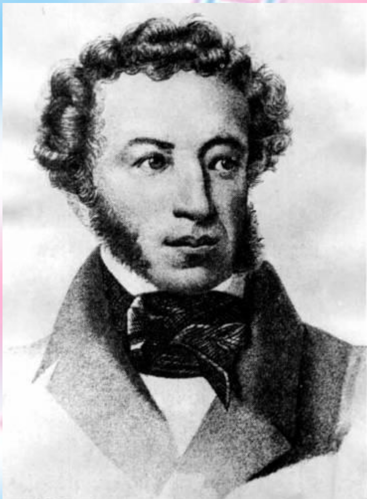
Портрет А.С.Пушкина 1833 года.

Вечером слушаю сказки – и вознаграждаю тем недостатки своего воспитания. Что за прелесть эти сказки! Каждая есть поэма!