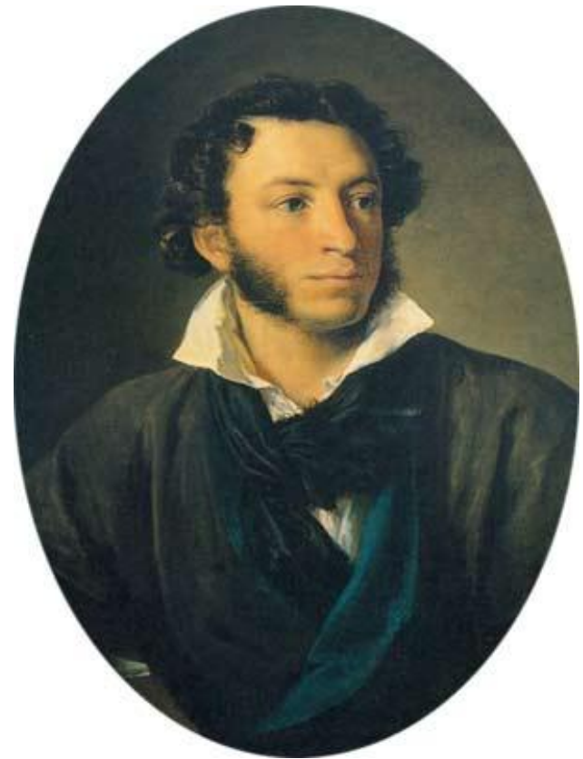
А.С.Пушкин. Портрет работы В.А.Тропинина. 1827 г.

Александр Сергеевич Пушкин.... Это имя сопровождает нас всю жизнь.