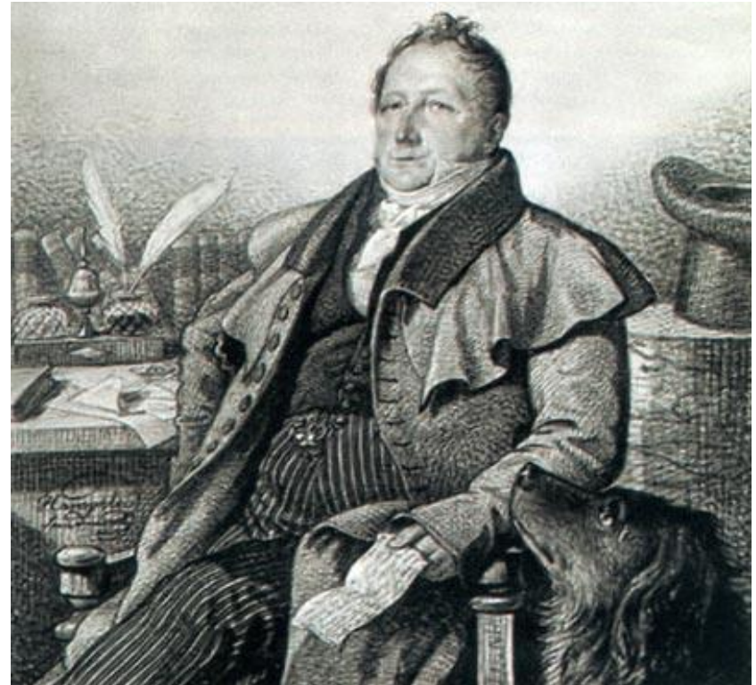
Сергей Львович Пушкин (1770-1848), отец поэта. Неизв. художник. 1810-е гг.

Отец поэта, Сергей Львович Пушкин. Отставной военный, был старинного рода, ноне богат и не слишком удачлив в службе и чинах.