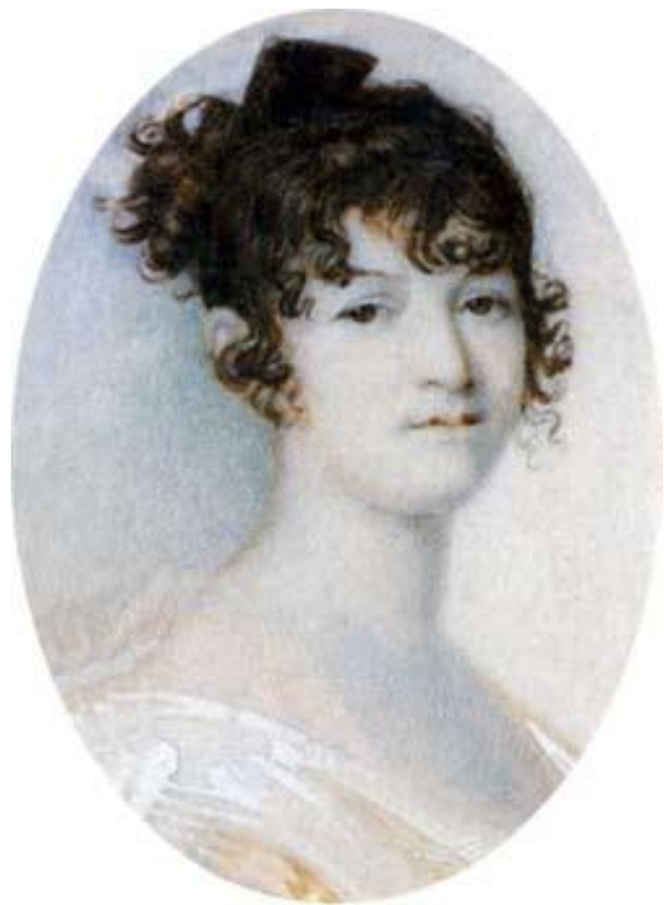
Надежда Осиповна Пушкина, рожд. Ганнибал (1775-1836), мать поэта. Художник Ксавье де Местр. 1800-е гг.

Мать поэта, Надежда Осиповна, была внучкой знаменитого Ибрагима Ганнибала.