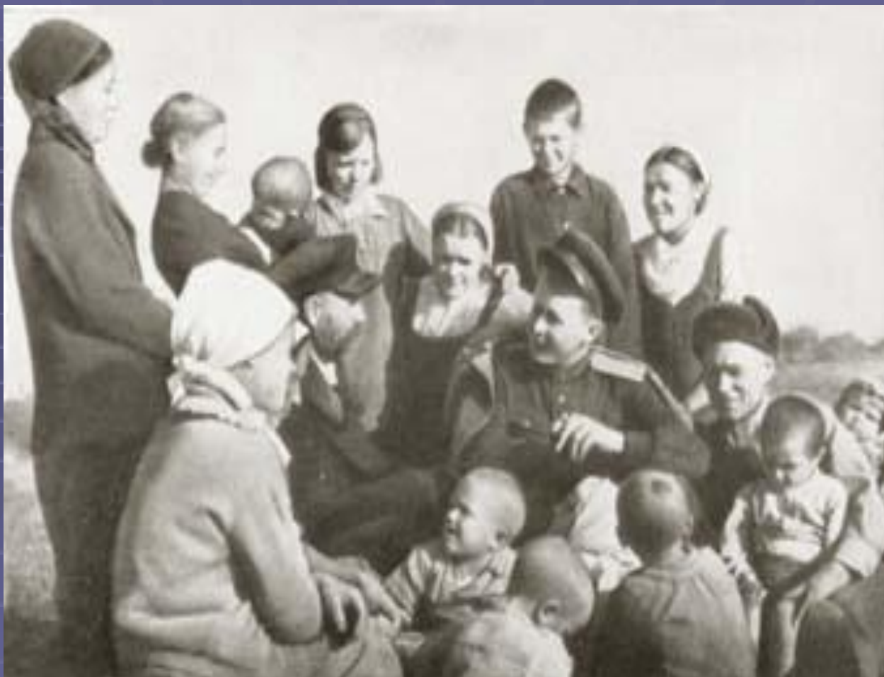
А.Т.Твардовский на Смоленщине 1943 год