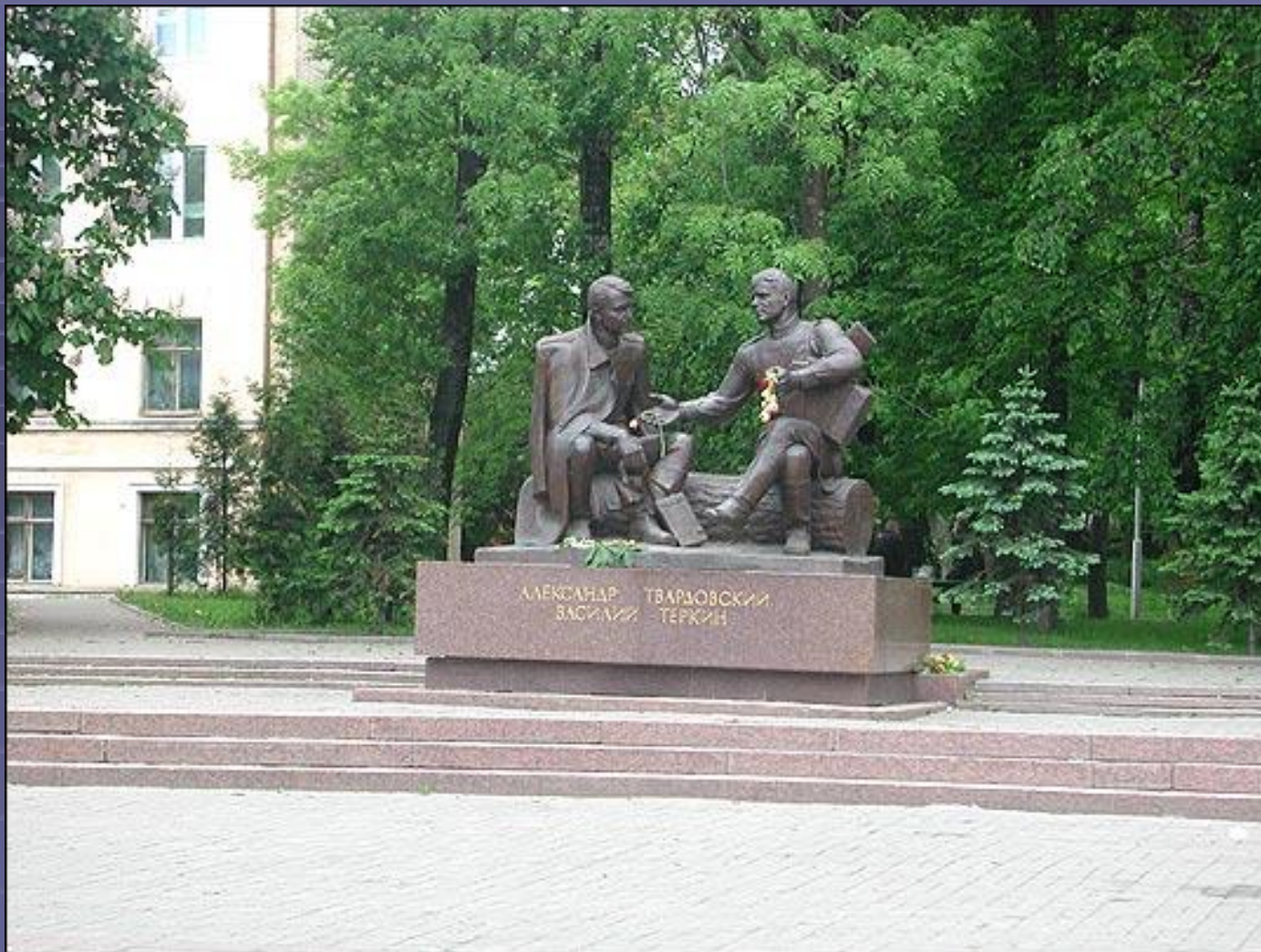
Памятник А.Т.Твардовскому и Василию Теркину в Смоленске