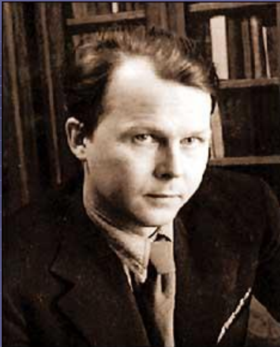
А.Т.Твардовский в 30-е годы